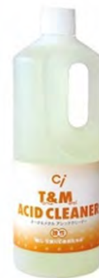
T&Mアシッドクリーナー