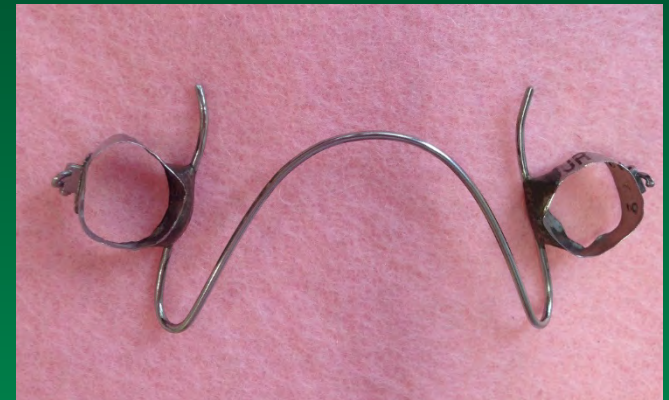
ポーター拡大装置